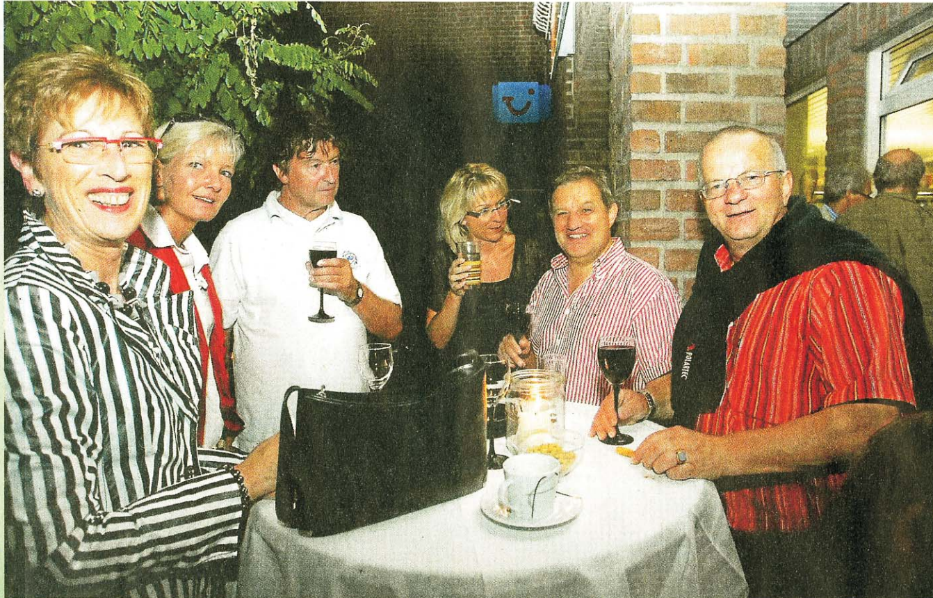
Das Leben spielt Freitagnacht wieder draußen: Bei Rotwein und Tiramisu, bei Antipasti oder zahlreichen anderen Leckereien. Bummeln, essen, fröhlich sein, lautet die Devise.

DAS KLEINE ATTELIER 9012 Lader - Hornscheidt Sandstr. 23 · 59387 Ascheberg Tel.: 0 25 93 / 16 60 www.das-kleine-atelier.biz